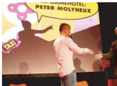
Themenroadshows verlangen die Einbindung von Multimedia in die Gesamtstruktur.

Medialogistik Kundenströme, Point of Sales oder Arbeitsplätze: alles wird dynamisch. Während Computerdaten wireless übertragen werden, muss die entsprechende Hardware nach wie vor physisch verschoben, in Betrieb gesetzt und gewartet werden. Wir können in kürzester Zeit mehrere technische Einsätze mit über zwei Dutzend eigenen Spezialisten parallel in der Schweiz und in Deutschland fahren.