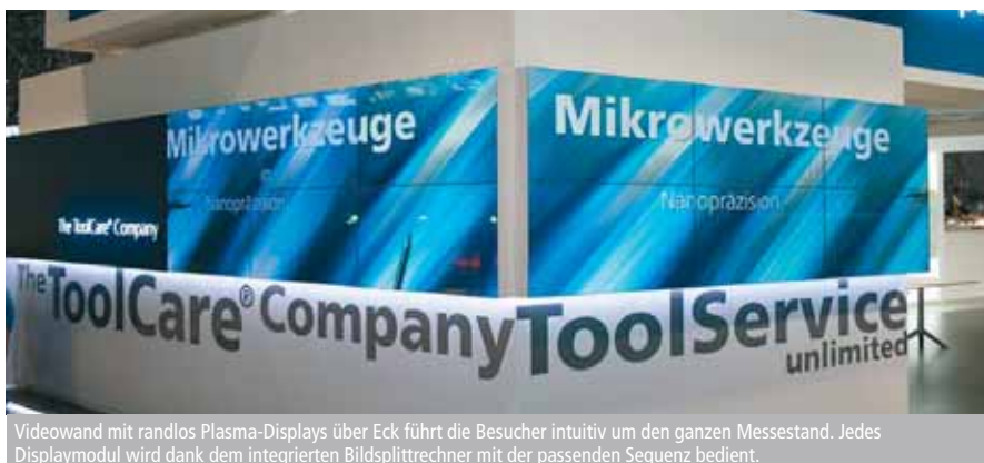
Videowand mit randlos Plasma-Displays über Eck führt die Besucher intuitiv um den ganzen Messestand. Jedes Displaymodul wird dank dem integrierten Bildsplittrechner mit der passenden Sequenz bedient.

Plasma-Displays können dem Baukörper angepasst werden: z.B. Anordnungen hochkantig, in einem bestimmten Radius, quer nebeneinander, hallenhohe Wandbestückung, Einbau in Pylon, begehbar auf trittsicherem Glas usw. Ab der Ideenfindung beraten wir Projektverantwortliche, Veranstaltungs- und Roadshow-Planer, Designer, Messebauer, Marketing-, Werbe- und Eventleiter und Architekten. DECATRON ist spezialisiert auf den individuellen, projektbezogenen Einsatz der Plasma-Module inklusive Engineering, Installation, Grafik- und Videoinhalte.