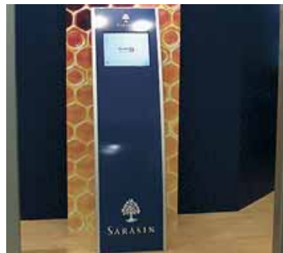
Interaktives Terminal auf Messestand mit kundenspezifischer Frontplatte nach Firmen-CD beschriftet.

Interaktive Terminals können mit nützlichen Zusatzfunktionen gezielt auf den vorgesehenen Einsatz ausgebaut werden: