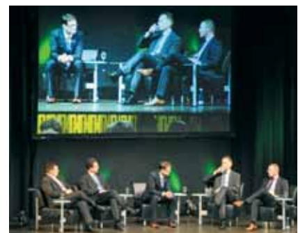
Podiumsgespräche erfordern höchste Konzentration bei der Regie und dem technischen Personal.