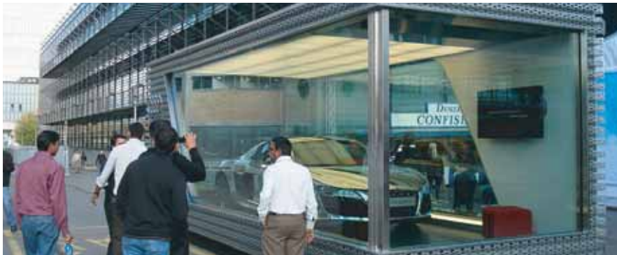
Roadshow vom Feinsten: Der gläserne Kubus zieht magisch die Blicke an sich. Beispiel einer gelungenen kompakten Präsentation von Produkt und multimedialer Kommunikation. Diese Kombination ist mobil und rasch aufgestellt.