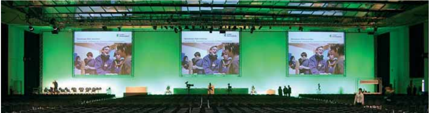
Unschlagbar was Leistung, Zuverlässigkeit und Serviceleistungen in den Disziplinen Medientechnik für kleinere, mittelgrosse und grosse Anlässe - einer der Kernkompetenzen von DECATRON und seit Jahren führend in der Schweiz.