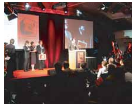
Roadshow in Form von Preisverleihungen sind attraktiv mit hohem Unterhaltungswert.