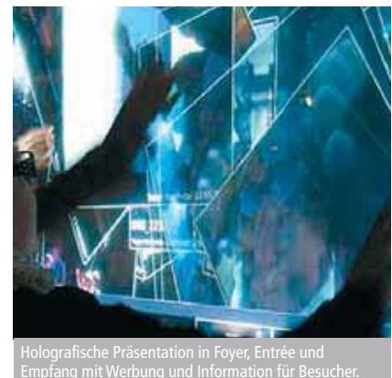
Holografische Präsentation in Foyer, Entrée und Empfang mit Werbung und Information für Besucher.