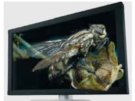
Hohe Auflösung und Tiefenwirkung mit Single-View für Anwendungen in Medizin, Pharma und Chemie