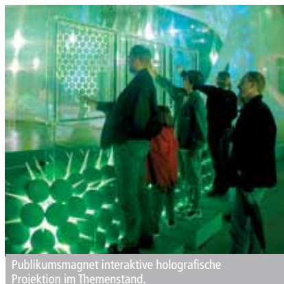
Publikumsmagnet interaktive holografische Projektion im Themenstand.