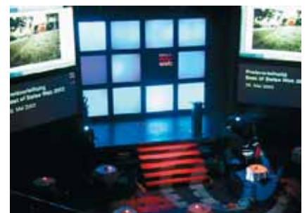
Roadshow als Anlass für ein auserwähltes Publikum zur Wahl von Medien. Einsatz von SMS-Voting ideal.