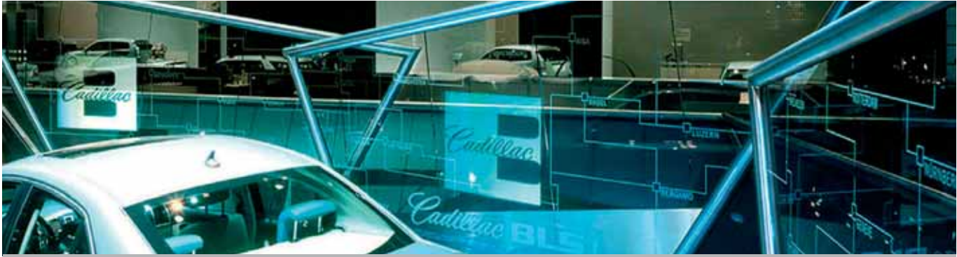
Projektion auf transparentes Glas am Beispiel eines Messestandkonzeptes. Die transparenten Projektionsflächen sind im Konzept einer Metallstruktur eingebettet. Die Projektoren sind im doppelten Boden des Standes eingebaut und somit unsichtbar.