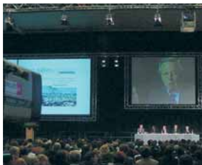
Echtzeitprojektion bei Anlässen via Kameraführung. Übertragung auch via Satellit.