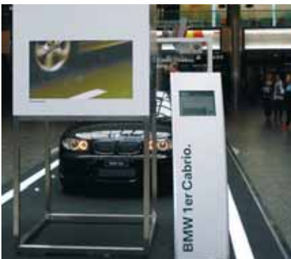
Infoterminal im Einsatz an Roadshows und als virtuelle messbare Verkaufshilfe am POS.