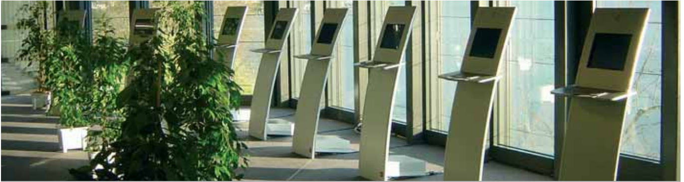
Für Kongresse stehen den Kongressteilnehmern mietweise 50 Terminals an verschiedenen Standorten zur Verfügung. Somit können während den Pausen Webnails und Kongress-Infos abgerufen werden, dienen als Check-in Terminals usw.