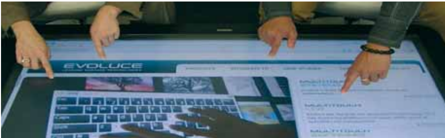
Mehrere Anwender können gleichzeitig Bilder, Videos und Grafiken aufrufen, verändern und verschieben, so wie man es vom iPhone her kennt: Nun auch für Public-Einsatz.