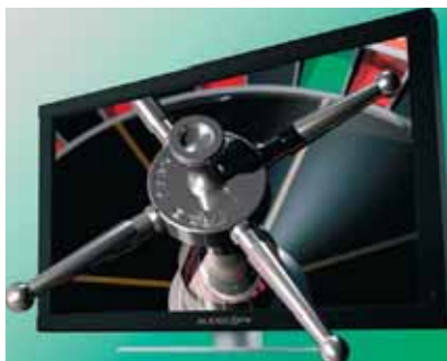
Realistische dreidimensionale Wiedergabe von Gegenständen, Landschaften, Tiere, Figuren usw.