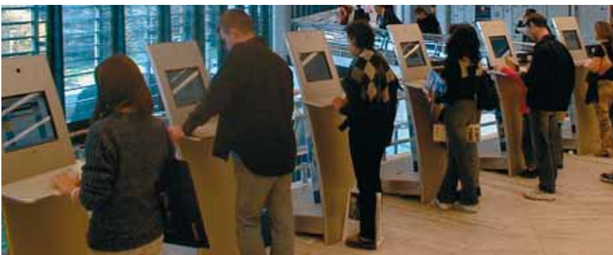
Interaktive Terminals im öffentlichen Bereich zum Abrufen von Informationen, als virtuelle Begrüssungs- und Informationssysteme an Kongressen, in Museen, an Messen und Events sowie an Roadshows für Infotainment.

Wir helfen Ihnen bei der Vernetzung zu anderen Geräten oder Content-Erstellung bis zum multimedialen Gesamtkonzept. DECATRON vermietet, verkauft, liefert und installiert die eleganten interaktiven Systeme für Roadshows, Foyers, Showrooms, Messen, Ausstellungen und Anlässen mit vielen Besuchern am Point of Information. Syntranet® sind die meist eingesetzten Internet-Terminals dieser Art in der Schweiz.