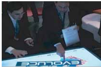
Die Oberfläche des Multitouch LCD erkennt gleichzeitig mehrere User - egal ob Berührung mit Finger oder Stift

DECATRON liefert und installiert dieses System Ready-to-use.