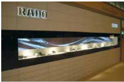
Raffinierte Kombination von Schaufensterauslagen und Plasma-Displays mit bewegten Wellen.