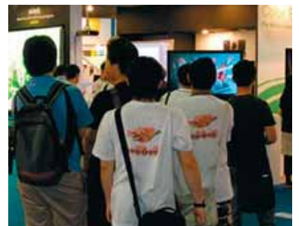
3D ohne Brille zieht das Publikum magisch an die Alioskopie-Monitore.

Preisbeispiel für Roadshow-Einsatz 3D-Multimedia 46" Multi-View mit intel-Spezialrechner Basismietpreis CHF 1'200.-