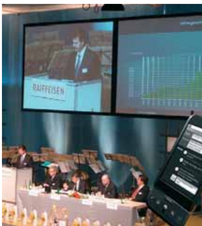
SMS Voting an Vereinswahlen, Petitionen, Umfragen, Miss- und Misterwahlen, Events, Roadshows usw.

(GRATIS wenn Eventtechnik durch DECATRON abgewickelt wird)