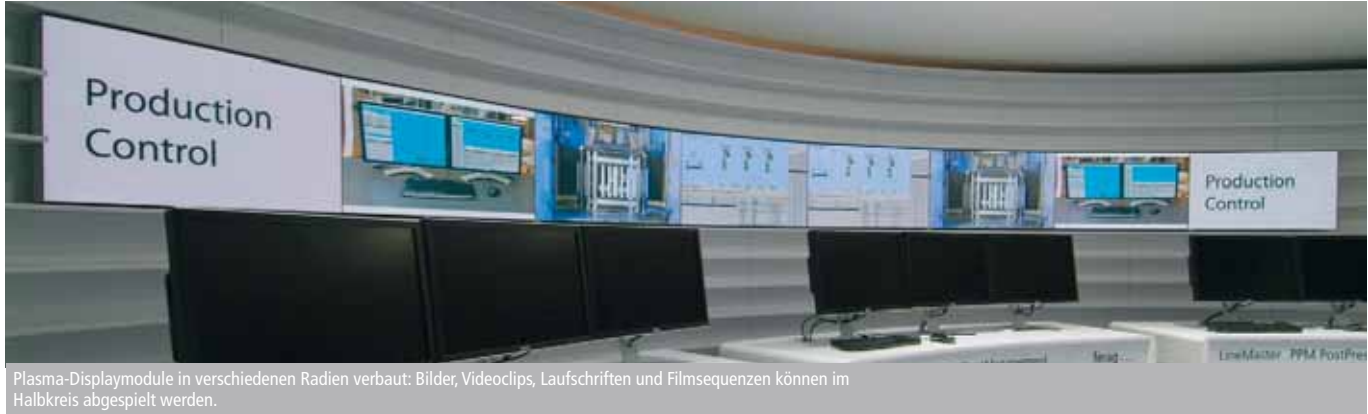
Plasma-Displaymodule in verschiedenen Radien verbaut: Bilder, Videoclips, Laufschriften und Filmsequenzen können im Halbkreis abgespielt werden.