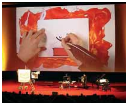
DECATRON plant, installiert und bedient auch Licht, Effekte und Ton.