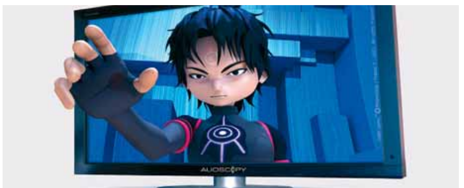
Infotainment über Flatpanels mit Alioskopie-Technik und beispielsweise 3D-Games machen den Event zum nachhaltigen Erlebnis. Das dauernde mitführen, reinigen und ersetzen der 3D-Brillen entfällt gänzlich.

Preisbeispiel für Roadshow-Einsatz 3D-Multimedia 46" Multi-View mit intel-Spezialrechner Basismietpreis CHF 1'200.-