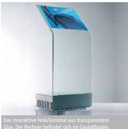
Das interaktive HoloTerminal aus transparentem Glas. Der Rechner befindet sich im Gestellboden.