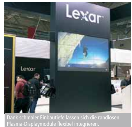
Dank schmaler Einbautiefe lassen sich die randlosen Plasma-Displaymodule flexibel integrieren.