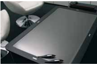
Informationen mit Emotionen - der interaktive Multitouch Full HD LCD ermöglicht eine neue Art der Kommunikation

Intelligent, flexibel, einzigartig zeigt sich der neue Multitouch Full HD im Einsatz mit einer interaktiven Oberfläche als Standalone Gerät. Das System ist so einfach wie genial: die speziell robuste Multitouch-Oberfläche mit der von Evolute entwickelten ITSO Sensing Technologie erkennt mehrere gleichzeitige Eingaben verschiedener Personen.