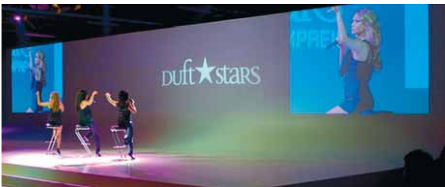
Event-Technik für grössere Roadshows und Promotions: Bühnentechnik mit Licht, Sound und Video. Von der Planung bis zur Installation sowie vor Ort-Support, bietet Ihnen DECATRON alles aus einer Hand.