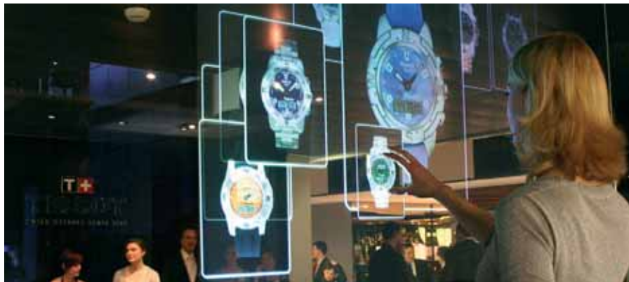
HoloPro mit Touch-Oberflächensensorik ermöglicht interaktive Projektionen - die Bildsequenzen werden von Hand dirigiert. Mobile Toucheinheiten sind in den Grössen 50" und 67" erhältlich.

Videoclips unter www.decatron.ch oder live erlebbar in unserem Showroom Volketswil.