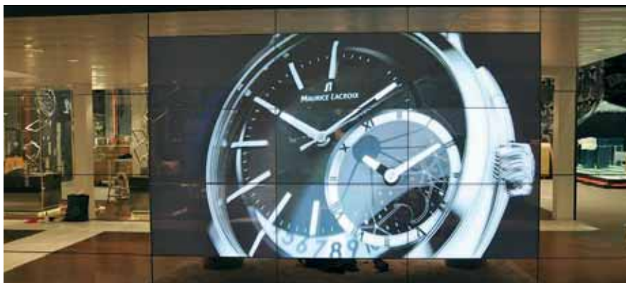
Imposante Präsentationen und Videoabspielungen machen Hallenwände zu dominanten visuellen Attraktionen. Die Wertigkeit der Darstellungen wirkt nachhaltig.

puter- oder Videosignal automatisch auf die Anzahl Bildschirm-Module segmentiert werden. Frontrahmenlos, geringe Bautiefe, intelligent und brillant sind einige Vorteile dieser Multi-PDP-Module. DECATRON bietet diese Module für Miete oder Kauf an, Support und Logistik inklusive. Projekte werden durch unsere Spezialisten von der Planung über die Objekt-Montage bis zur Bildproduktion betreut.