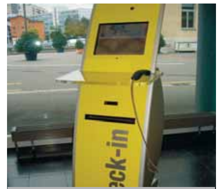
Sonderbau interaktives Terminal als virtueller Portier mit Optionen Webcam, Telefon, Drucker für Plan usw.

In Schalterhallen und im öffentlichen Raum (z.B. im Gemeinde- und Stadthaus, Ämter usw.) stehen die Terminals jederzeit für Informationen oder als Selbstbedienungs-Terminals im Einsatz.