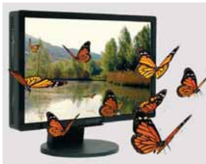
Die auf dem Monitor aufgesetzte Lentikularlinse erzeugt eine 3D-Tiefenwirkung ohne 3D-Brille.

Die einzigartige Tiefenwirkung von Contents in 3D verleiht der Video-Animation und 3D-Filmen eine neue Optik. Alioskopie heisst eine in den USA entwickelte leistungsstarke 3D-Multimedia-Display-Technologie. Was nur in 3D-Kinos möglich war, kann jetzt auf jedem Messestand, an jeder Roadshow, im Schaufenster, am POS usw. gezeigt werden. Noch besser: ohne 3D-Brillen . Der Einsatz ist einfach: Monitor mit Lentikularlinse, Rechner mit passendem Content und schon scharen sich die Passanten oder Gamer um Ihren Monitor.