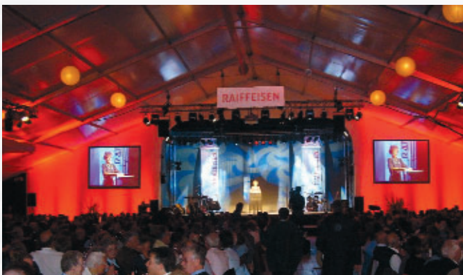
Generalversammlungen und Firmenevents als Bestandteil der Corporate Communication, fördern Bindungen zu Kunden, Mitarbeitern und Investoren