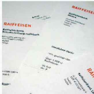
Zahlreiche Dankeschreiben referenzieren die Professionalität, den perfekten Service von der Planung bis zur Ausführung und die Logistik