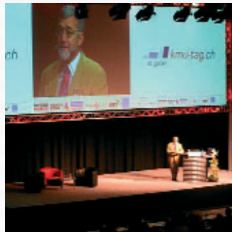
Satellitenübertragung, Webcasting und Regiewagen werden zu einem zuverlässig funktionierendem System zusammengestellt und vor Ort bedient