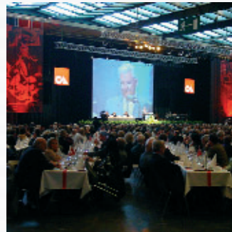
Generalversammlung: Ausgereifte Technik aus einer Hand