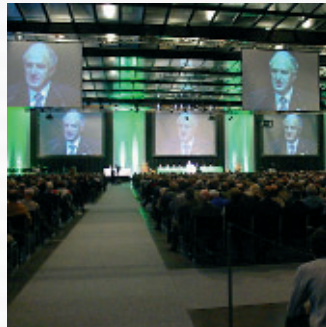
An mehreren Orten gleichzeitig informieren per Satellitenübertragung