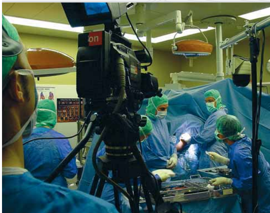
113 Videoaufnahmen, Codierungen und Direktübertragung