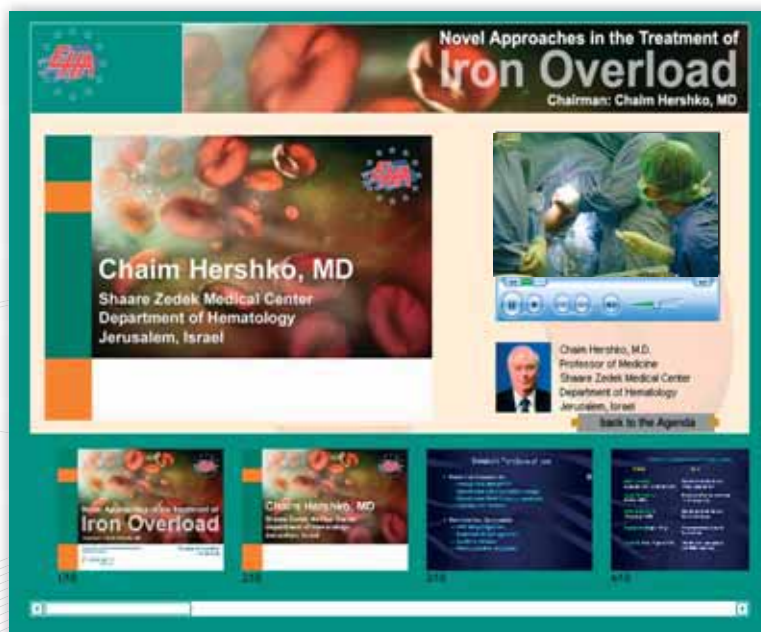
112 Livesendungen im Internet und Intranet. Auf Wunsch mit Zugangscodes

Je nach Grösse und Wichtigkeit des Anlasses (wie zum Beispiel ein WEF Davos), bedingt eine komplette Webcasting-Infrastruktur mit entsprechenden Spezialisten. DECATRON verfügt über IT-Fachleute, Netzwerktechniker und AV-Spezialisten.