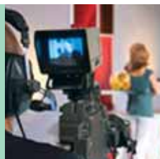
115 Schulungsprogramme per Internet