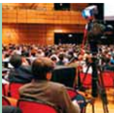
114 Übertragen Grossanlass auf Internet