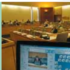
116 Aufnahme in Universität