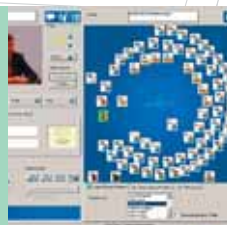
117 Digitale Regieprogrammierung